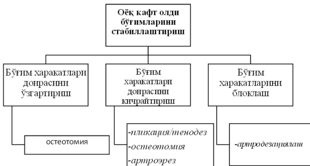
Расм 1.Оёқ кафт олди бўғимларини стабиллаштириш тамойиллари.

Кириш. Жарроҳлик даволаш тамойиллари. Ясси оёқли болаларни жарроҳлик даволашнинг асосий тамойили бу, стабиллаштиришдир, чунки ясси оёқликнинг асосий биомеханик моҳияти ностабилликда. Оёқнинг кафт олди бўғимларини стабиллаштириш усуллари 1-тасвирда келтирилган.